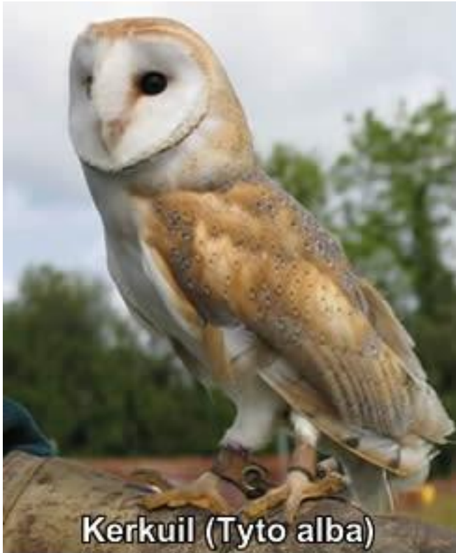
Kerkuil ( Tyto alba )

Ze kunnen ook heel goed zien, ook in het donker, want ze hebben een soort (nacht)telescoop in hun ogen. En daarom kunnen ze ook niet draaien.